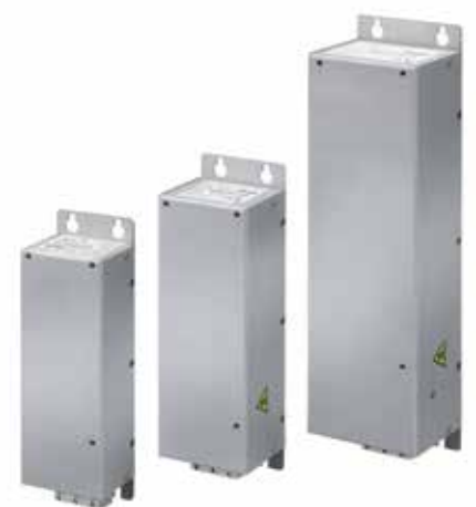
Afmetingen De verschillende netfilters komen overeen met de M1, M2 en M3 behuizingen van de VLT® Micro Drive